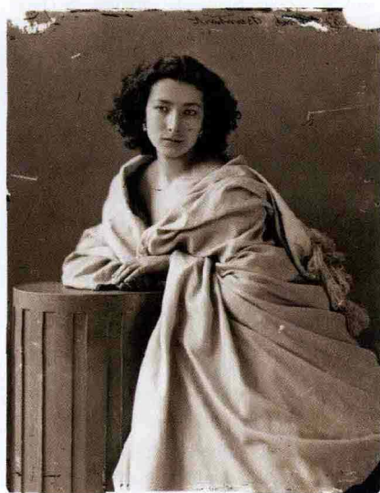
L'attrice Sarah Bernhardt ritratta da Nadar.

Ecco le sedi delle mostre dedicate al genio di Nadar: presso il Centre culturel Saint-Louis de